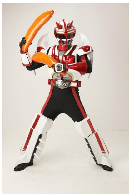
名前:超耕21ガッター 米を愛するヒーロー