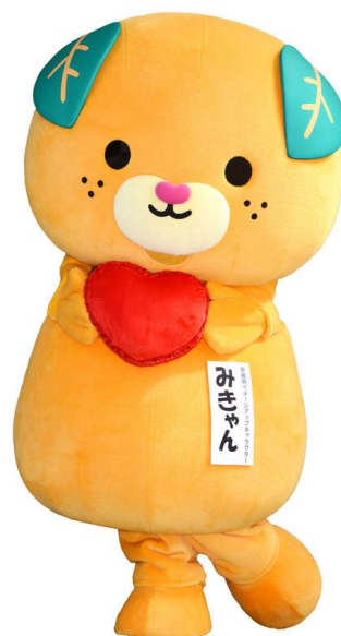
名前:みきゃん ゆるキャラグランプリ2015 第2位受賞