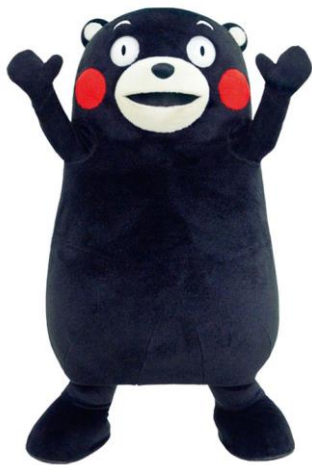
ゆるキャラグランプリ2011 第1位受賞